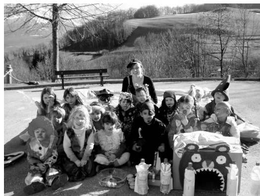
Tous déguisés pour le carnaval