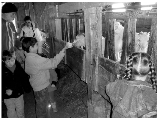
Sortie « chèvres » à St Pancrasse